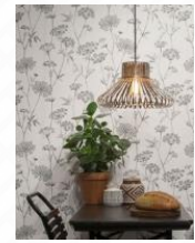
Twoja aranżacja lokalu

VA zryczałtowane opłaty eksploatacyjne i marketingowe – brak rozliczeń i nieoczekiwanych dopłat na koniec roku!